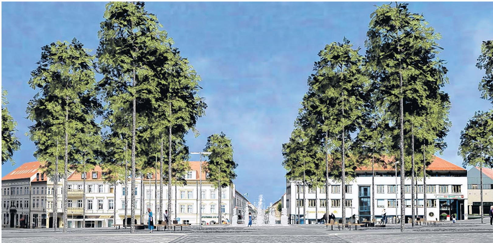
Täuschend realistisch: Eine Planungsvision des Neustrelitzer Marktplatzes in einem 3D-Modell des Unternehmens GTA Geoinformatik.

Netik schickt seine „jungen Leute“ nach Hannover. „Die gehören auf so einer Messe nach vorn“, findet er. Die Liste der Anwendungen, die das Unternehmen mit zur CeBIT nehmen wird, ist lang. „Unser Angebot, die Online-Services in Anwendungen und Systeme zu integrieren, richtet sich an Fachbesu-